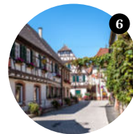
6 Haltestelle St. Martin Ort

Flanieren Sie doch vom Schafplatz aus durch die Edenkobener Pädel oder steigen Sie in den Wanderbus 506 ins Edenkobener Tal um die Sehenswürdigkeiten im Edenkobener Tal zu erreichen: Villa Ludwigshöhe, den Hilschweiher, Hüttenbrunnen, Forsthaus Heldenstein und das Modenbachtal. Von hier aus fährt der Bus zurück über Weyher und Rhodt und nach Edenkoben. → garten-eden-pfalz.de