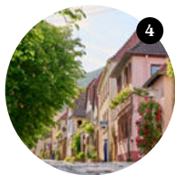
4 Stopp Rhodt unter Rietburg Rhodt Mitte

Mitte im Dorf steht der Röhrenbrunnen von 1561 umgeben von historische Gebäude im Stil der Renaissance, des Rokoko und des Barock. Daneben gibt es Vinotheken, die Tradition mit moderner Architektur verbinden, Hainfeld lebt von und mit dem Wein. Es hat eine spannende Kulturszene mit Ateliers, Galerien und dem Internationalen Klavierfestival im Spätsommer. → hainfeld.de