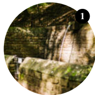
1 Stopp Gleisweiler Mitte

So schön wie einst Königin Therese können auch Sie heute entlang der historischen Fassaden unter Kastanienbäumen flanieren. Die berühmte Theresienstraße bildet das Herzstück des Ortes Rhodt unter Rietburg. Überall lassen sich Details entdecken: alte Hoftore, besondere Schlusssteine, üppiger Blumenschmuck ... → rhodt.de