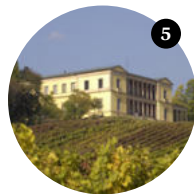
5 Stopp Edenkoben Schafplatz

Der St. Annaberg ist schon lange Zeit ein beliebtes Ziel für Wallfahrer wie Wanderer. Über den Burriweg erreichen Sie die St. Annakapelle und haben einen herrlichen Blick über Rheintal, Odenwald und Schwarzwald. Wer früh morgens den ersten Bus nimmt, kann den Sonnenaufgang beobachten.