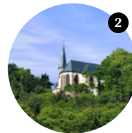
2 Stopp Burrweiler Mitte

Von Gleisweiler gehen Sie ein Stück ins Tal und in den Wald hinaus, um zur einzigen historischen Walddusche Deutschlands zu kommen. 1848 von einem örtlichen Arzt erbaut und in den 1990er Jahren instand gesetzt, führt die Anlage acht bis zwölf Grad kaltes Wasser. → walddusche.de