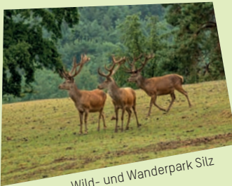
Wild- und Wanderpark Sitz